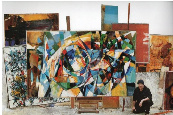
L'artista Piero Tartaglia

Para concluir, os trabalhos do Mestre de alguma forma marcam o "ponto de impossibilidade" de construir o limite dessa impossibilidade. E é por isso que pode haver um novo interesse a partir de obras como a sua, colocadas na conclusão da impossibilidade, da renúncia do projeto material. Sua arquitetura tem essa capacidade da imagem repentina, como uma revelação, como uma aparição. Aparição de uma linguagem visual que utiliza as convenções da cor para conferir verticalidade às estruturas arquitetônicas imbuídas do equilíbrio entre o natural e o artificial, entre a natureza e a linguagem, entre a superestrutura e a história. Coisas que todos os arquitetos devem carregar dentro de si.